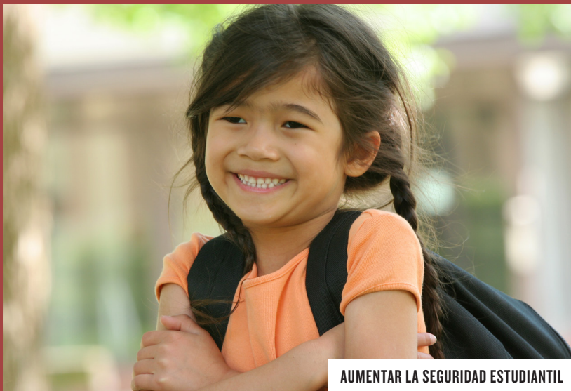
AUMENTAR LA SEGURIDAD ESTUDIANTIL