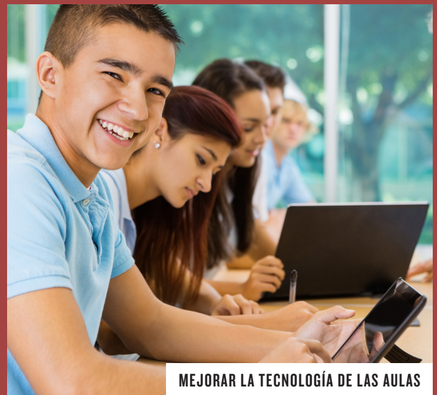
MEJORAR LA TECNOLOGÍA DE LAS AULAS

LAS BOLETAS DE VOTACIÓN POR CORREO DEBEN LLEVAR EL MATASELLOS POSTAL FECHADO PARA EL 3 DE NOVIEMBRE DE 2020