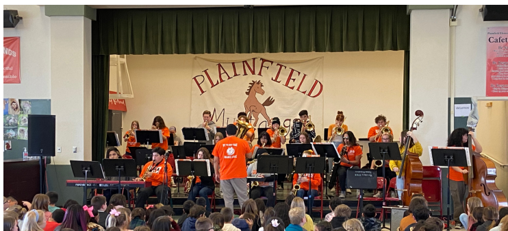
Estudiantes de la Escuela Preparatoria Woodland actuando en la Escuela Primaria Plainfield