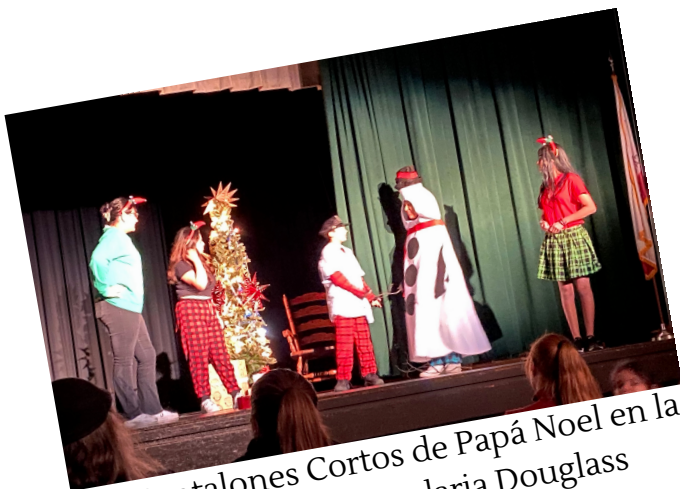
Pantalones Cortos de Papá Noel en la Escuela Secundaria Douglass

Presentaciones recientes en Woodland en nuestras escuelas