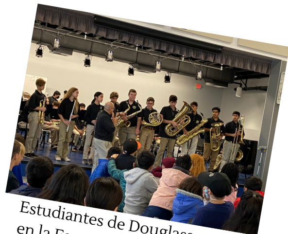
Estudiantes de Douglass actuando en la Escuela Primaria Spring Lake